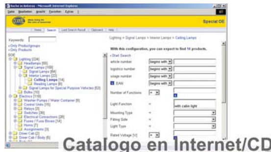
Catálogo en Internet/CD

La edición de los datos de producto se efectúa de una manera eficaz a través de formularios online o a través de un filtro de importación para XML. Mecanismos como herencia y gamas de productos reducen el esfuerzo requerido al mínimo. Además también es posible modificar o ampliar la clasificación de productos a voluntad y a través de formularios online, lo que disminuye considerablemente tanto el tiempo como los costes del proceso de edición.