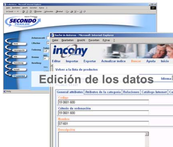
Edición de los datos